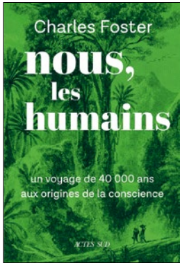
Charles Foster (2025): Nous, les humains: Un voyage de 40 000 ans aux origines de la conscience. Actes Sud