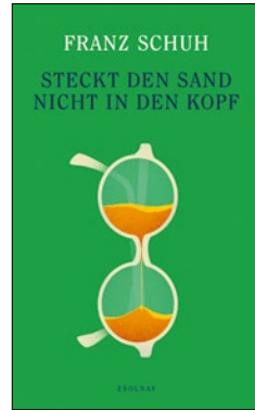
Franz Schuh (2025): Steckt den Sand nicht in den Kopf. Zsolnay