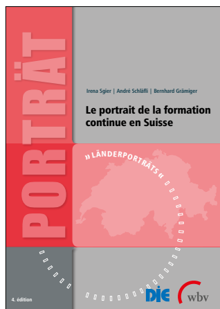
Sgier, Irena / Schläfli, André / Grämiger, Bernhard (2022): Portrait de la formation continue en Suisse. Bielefeld: wbv